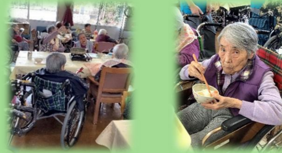
美味しい料理に職員の芸が豊富で賑わいました！ 利用者の皆さんの笑顔がたくさん見れました！