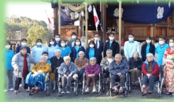
四十九池神社に初詣に 行ってきました。 今年1年の健康を祈りました！