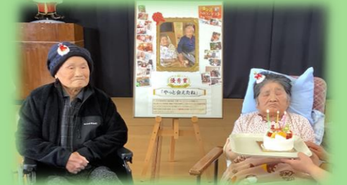
ご夫婦の写真でテーマは「やっと会えたね」。おめでとうございます！