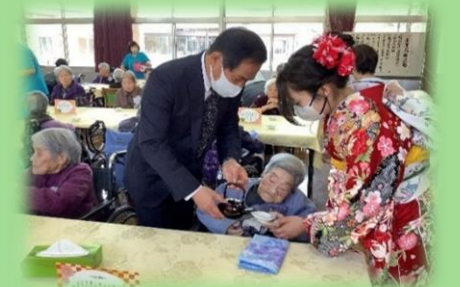
若い職員が着物を着てお屠蘇 を振舞い、利用者の皆さんに召 し上がっていただきました！