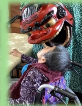
今年も勢いよく 迫力のある獅子の舞い！